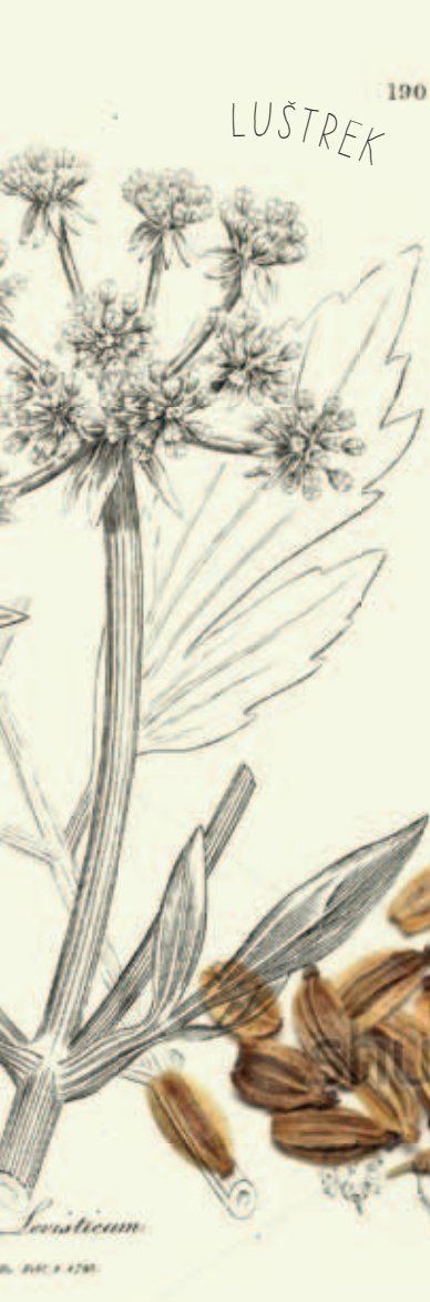
Cvetoča zel luštreka ( Levisticum officinale )